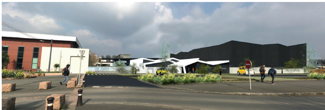
© Atelier Garçonnet Architectes à Saint-Brieuc